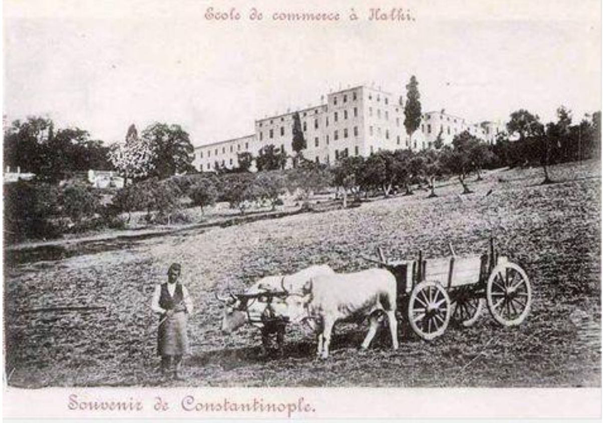
Heybeliada Deniz Lisesi Hazırlık Sınıfı Binası. Eski Rum Ticaret Okulu